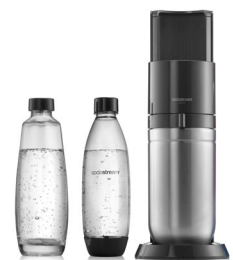
Die SodaStream DUO sprudelt in Glas- und Kunststoffflaschen.