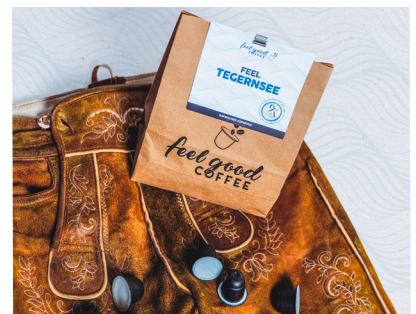
„Feel Tegernsee“ – der heimische Kaffeegenuss mit Tegernsee Feeling