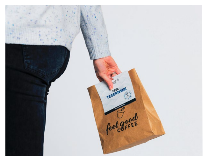
Kaffeegenuss serviert in nachhaltigen Biokapseln