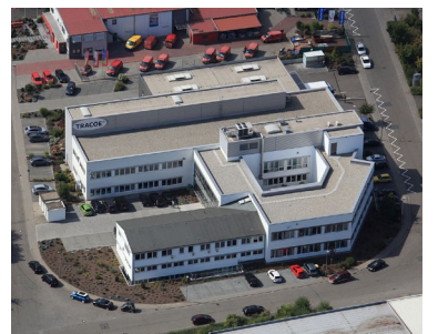
TRACOE medical zog für das erste Halbjahr 2021 eine positive Bilanz.