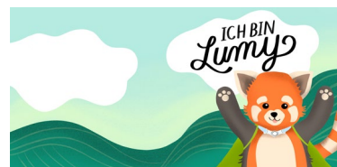
Lumy, das neue Maskottchen der Produktgruppe TRACOE kids