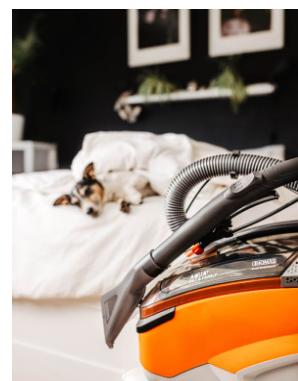
Praktisch: Die Aufsätze der Tierliebhaberstaubsauger.