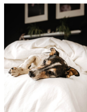
Tierliebhaberstaubsauger: Entspannt durch den Fellwechsel.