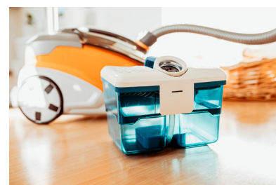
Die AQUA-Frische-Box bindet Tierhaare, Schmutz und Staub zuverlässig.