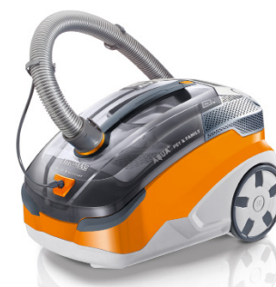
Beliebt bei vielen Haustierbesitzern: der THOMAS AQUA+ Pet & Family.