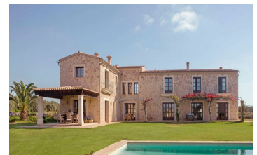
Im exklusiven THE BALANCE Therapiezentrum auf Mallorca werden u. a. posttraumatische Belastungsstörungen (PTBS) und die sogenannte Covid-19-PTBS behandelt.