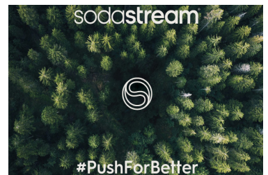
SodaStream inspiriert dazu, bessere Entscheidungen für sich und für die Umwelt zu treffen.