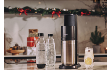
Der Wassersprudler SodaStream DUO aus der neuen Premium-Produktlinie SodaStream Collection