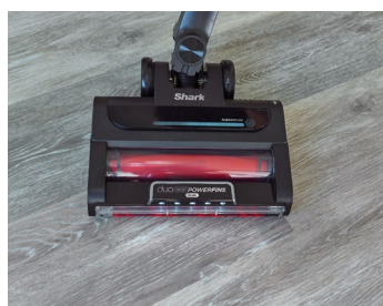
Clean Sense iQ für die automatische Anpassung der Reinigungsleistung