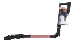
Das flexible Saugrohr sorgt für optimale Reinigung auch unter Möbeln.