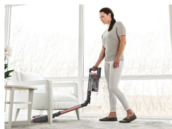
Dank Flexology ist Saugen auch unter Möbeln möglich.