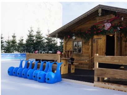
Kleine Wale dienen als Eislaufhilfen, z. B. für Kinder, die ohne Schlittschuhe auf die Bahn möchten.