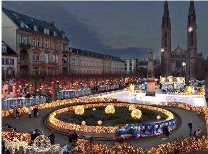
Ab 25. November heißt es Luisenplatz on Ice.

Alle Bilder können ab sofort unter www.deutscher-pressestem.de heruntergeladen werden: