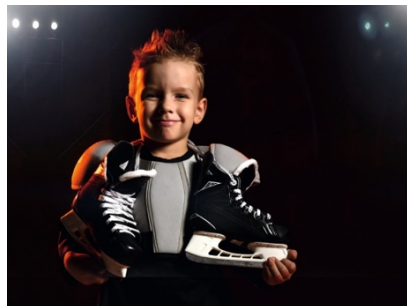
Auf der Eisbahn können sich Kinder im Alter von 4 bis 12 Jahren austoben.