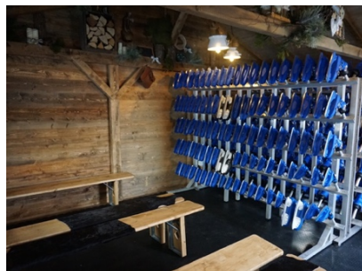
Praktisch: Ein beheiztes Wechselzelt, beheizte Schlittschuhständer und Schließfächer.