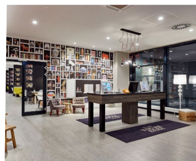
Im LÉGÈRE EXPRESS ist kontaktloses Ein- und Auschecken möglich