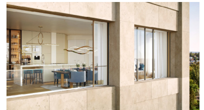
Die Window Loggias ermöglichen das komplette Öffnen der Fensterfronten.