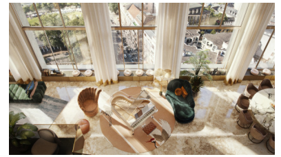
In den obersten beiden Etagen befindet sich ein exklusives Penthouse mit einer Gesamtfläche von fast 500 qm.

Weitere Informationen zum Projekt sind auch unter www.kureck-wiesbaden.de abrufbar.