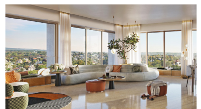
Im Wohnturm KURECK entstehen 66 einzigartige Wohneinheiten, die einen atemberaubenden Blick über Wiesbaden ermöglichen.