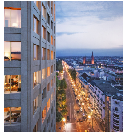
Der 64 Meter hohe Wohnturm KURECK wird zu Wiesbadens neuer erster Adresse.