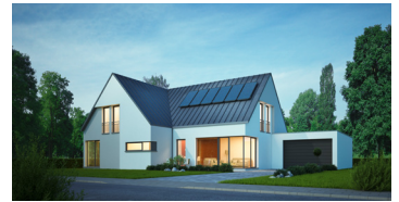
Kopp bietet ganzheitliche Photovoltaiklösungen und auch eigene Solarmodule.