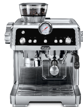
Neuer Siebträger „La Specialista“ von De’Longhi