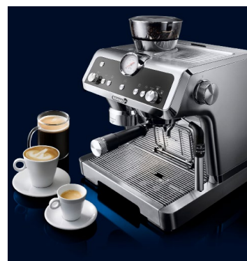
Barista für die eigenen vier Wände: „La Specialista“ von De’Longhi