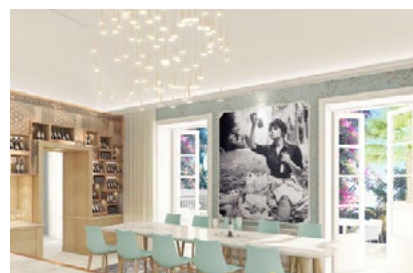
Bar „Azurro“ in stilvollem Design