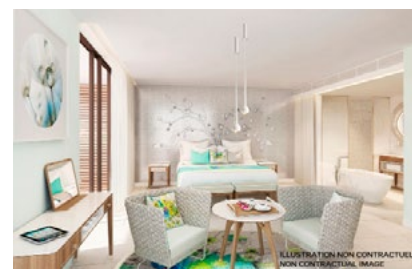
Zimmeransicht Viletta Deluxe