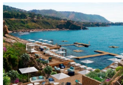
Direkter Meerzugang im Beach Club