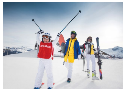
Pisten für jedes Leistungsniveau warten auf große und kleine Wintersportler.