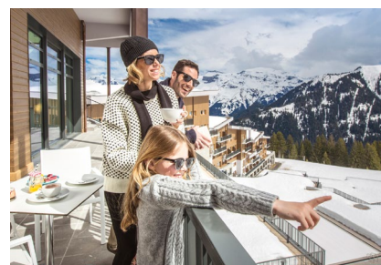
Mit Club Med den perfekten Familienurlaub inmitten der Französischen Alpen erleben.