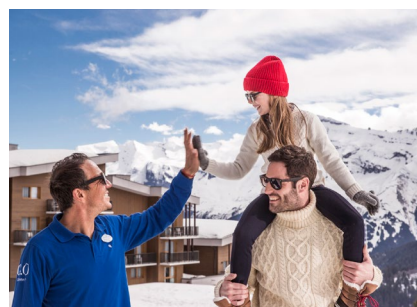
Bei Club Med sind die Kleinen ganz groß.