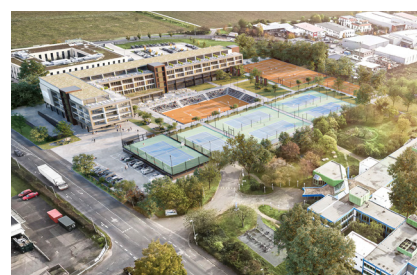
Die Boris Becker International Tennis Academy wird größer als ursprünglich geplant.