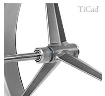
Handmade in Germany: von der Felge bis zum Ledergriff