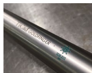
Handmade in Germany: individuelle Gravuren