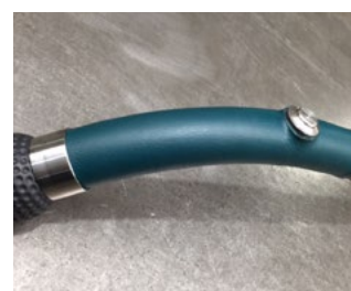
Eigene Ledermanufaktur mit erlesenem Material