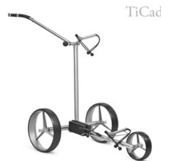
Design- und Technologie: der TiCad Liberty