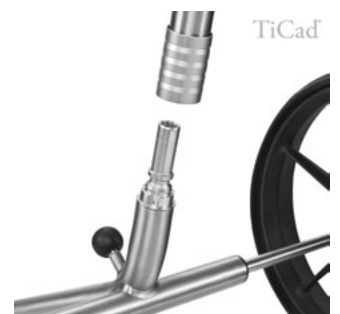
Präzise Arbeit für beste Qualität und Design aus einem Guss