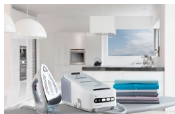
Perfekt aufgebügelte Designs mit der CareStyle 7 Pro